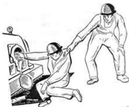
Рис. 3. Освобождение пострадавшего от действия электрического тока путем отключения электроустановки