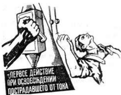
Рис. 1. Освобождение пострадавшего от действия электрического тока путем отключения электроустановки

6.1. Быстрое отключение от действия электрического тока это первое действие для спасения пострадавшего.