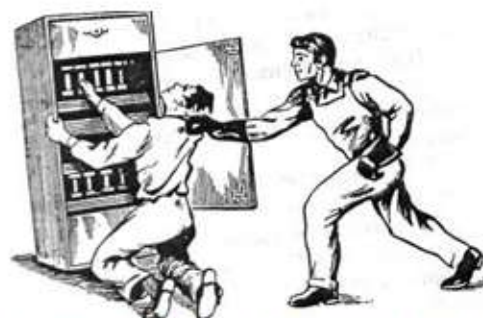
Рис. 4. Освобождение пострадавшего от токоведущей части электрического тока

6.2. При поражении электрическим током необходимо быстро освободить пострадавшего от действия тока - немедленно отключить ту часть электроустановки, которой касается